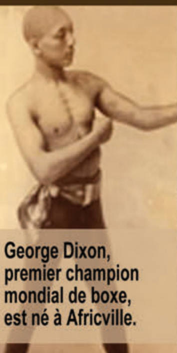
George Dixon, premier champion mondial de boxe, est né à Africville.

PRIÈRE DE FAIRE BOUILLIR L'EAU AVANT DE LA CONSOMMER