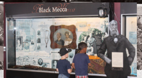
Musée et Société de l'histoire des Noirs de Chatham-Kent : Au début des années 1800, des familles noires s'établissent sur les rives du ruisseau McGregor, dans le petit village de Chatham. Celui-ci devient vite un refuge pour les esclaves en fuite. En 1850, les Noirs composent le tiers de sa population. Une fois rendus à Chatham, les anciens esclaves prospèrent à tous les égards : commerce, éducation, médecine, sports, littérature et culture. Leur succès amène d'autres Noirs de partout en Amérique du Nord à venir s'établir dans la région.