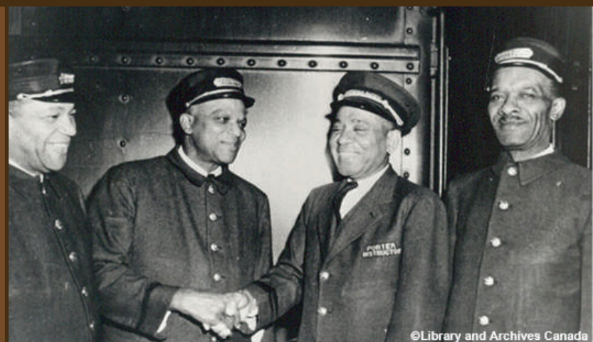
Fraternité des porteurs de wagons-dortoirs : En 1917, les porteurs noirs du Canada fondent le premier syndicat de travailleurs ferroviaires noirs en Amérique du Nord. En 1939, ils deviennent membres de la Fraternité des porteurs de wagons-dortoirs. Les deux syndicats luttent contre le racisme et contre les nombreux obstacles auxquels les porteurs font face au travail.