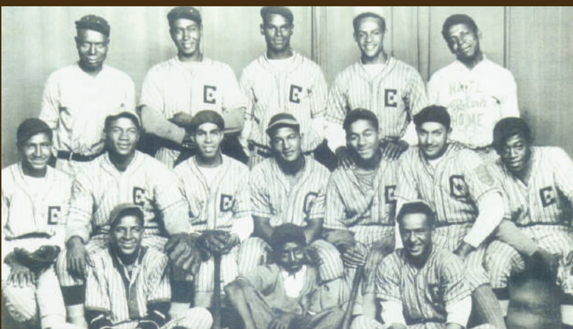
Chatham Coloured All-Stars : Première équipe composée uniquement de Noirs à remporter le championnat provincial de baseball (1934). Malgré le racisme et la discrimination dont ils font l'objet (ils ne peuvent pas dormir à l'hôtel ni manger dans certains restaurants), ils viennent à bout de tous les obstacles et remportent le championnat.