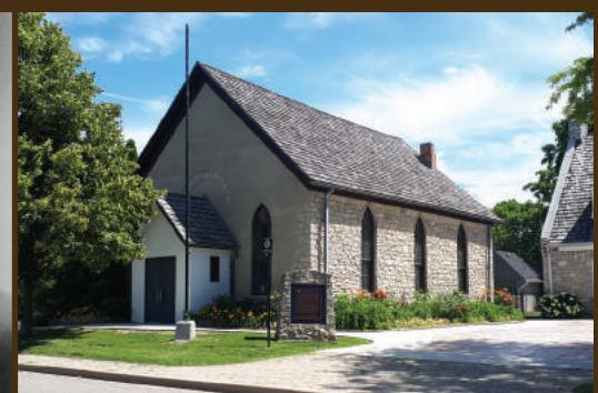
Église épiscopale méthodiste africaine Nazrey : Bâtie en 1848, l'église accueille les « passagers » du chemin de fer clandestin.