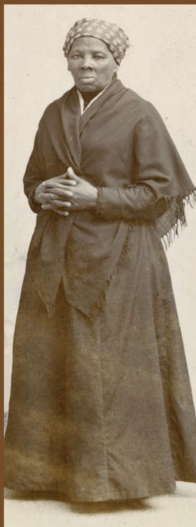
Harriet Tubman : Militante américaine, elle a consacré sa vie à lutter contre l'esclavage, à aider les autres et à se battre pour la liberté et l'égalité. Elle a vécu pendant un certain temps à St. Catharines, où prenait fin le chemin de fer clandestin. Elle a effectué au moins dix passages et guidé plus de 70 personnes, y compris sa propre famille, vers la liberté au Canada.