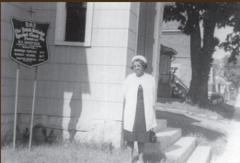
Addie Aylestock : Pasteure de l'Église épiscopale méthodiste africaine, elle est la première femme ordonnée au sein de cette église et la première femme noire à recevoir l'ordination au Canada.